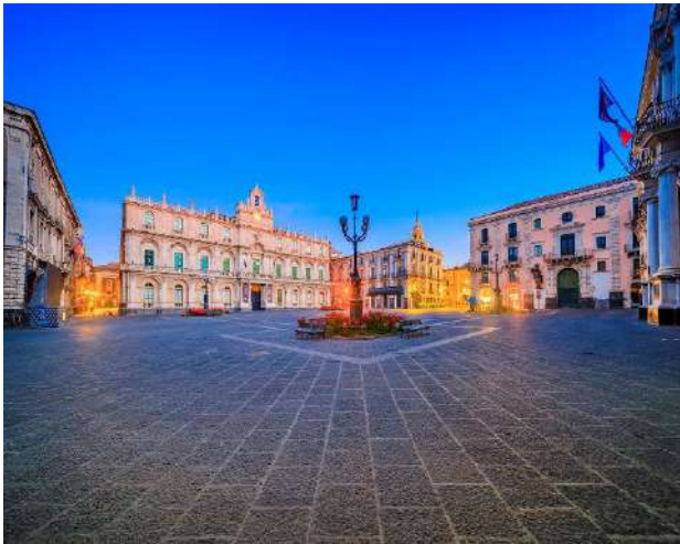
PIAZZA TEATRO MASSIMO